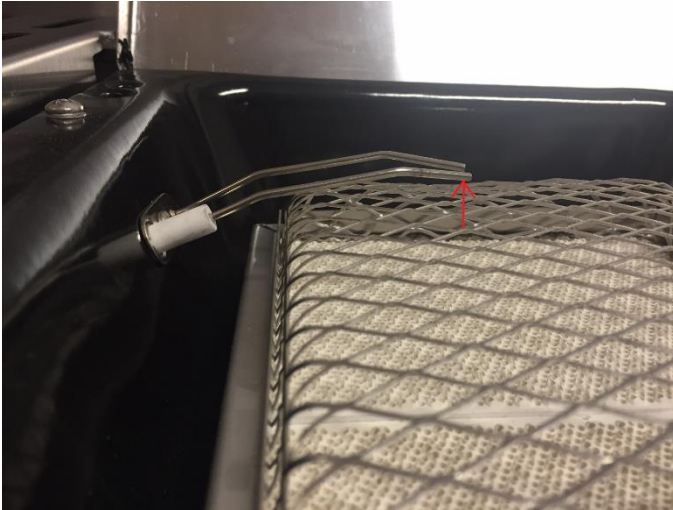
Zwischen Elektrode und Gitter: 5-8 mm

Die Sizzlezone funktioniert, aber die Zündung nicht, obschon eine Funke sichtbar ist.